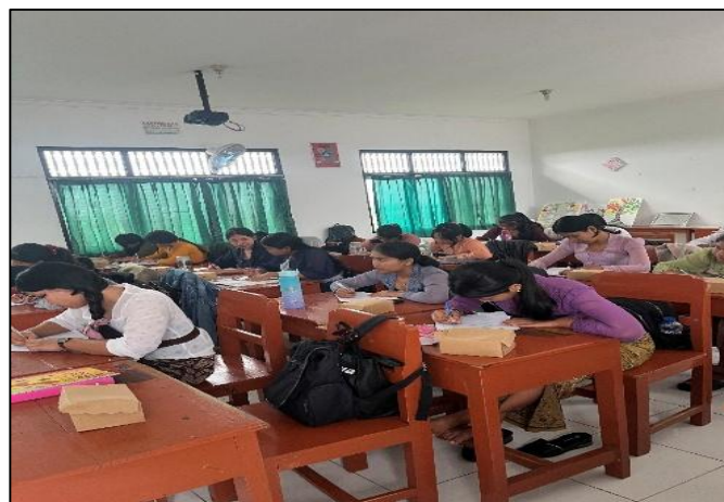
Gambar 1. Dokumentasi proses Pre-Test

Kegiatan PkM berupa "Edukasi Metode Mindful Journaling dalam Peningkatan Strategi Manajemen Stres pada Remaja" dilaksanakan pada Kamis, 13 Februari 2025. Peserta kegiatan merupakan siswa-siswi kelas XI berjumlah 24 orang yang terdiri dari 20 orang siswi (83,3 %) dan 4 orang siswa (16,7%). Sebelum kegiatan edukasi dimulai, dilakukan pre-test pengetahuan untuk mengetahui pemahaman awal siswa-siswi mengenai konsep stres dan manajemen stres. Pre-test dilakukan selama 10 menit yang terdiri dari 10 pernyataan benar-salah. Kegiatan PkM kemudian dilanjutkan dengan pemberian materi edukasi untuk meningkatkan pengetahuan siswa-siswi terkait manajemen stres.