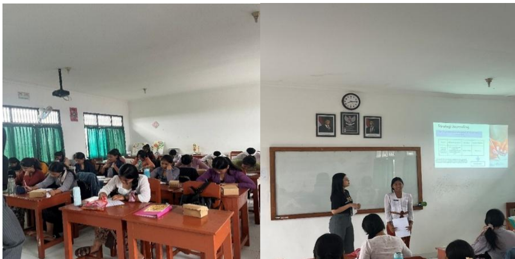
Gambar 2. Dokumentasi proses edukasi dan latihan mindful journaling