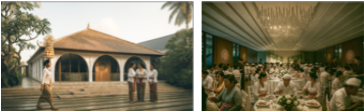
Gambar 5. Contoh gambar untuk marketing eksterior ballroom (kiri) dan interior ballroom (kanan)

Pelaksanaan PKM di Griya Gede Kemenuh Keramas menunjukkan bahwa perencanaan dan perancangan ruang tidak hanya bersifat teknis, tetapi juga menjadi instrumen strategis untuk menjaga keberlanjutan budaya Bali. Hasil observasi, FGD, dan analisis program ruang membuktikan bahwa kebutuhan fasilitas ritual dan pendidikan spiritual harus dipenuhi secara terstruktur melalui desain Pasraman dan event space . Pendekatan ini sejalan dengan pandangan Budiana & Gorda (2017), bahwa institusi tradisional seperti Desa Adat memegang peran sentral dalam menjaga praktik budaya, spiritual, dan sosial. Dengan menyediakan ruang fleksibel yang memungkinkan kegiatan ritual, pendidikan, serta aktivitas komunitas, desain ini tidak hanya mempertahankan tradisi tetapi juga mencegah terjadinya cultural severance sebagaimana dinyatakan oleh Rotherham (2013).