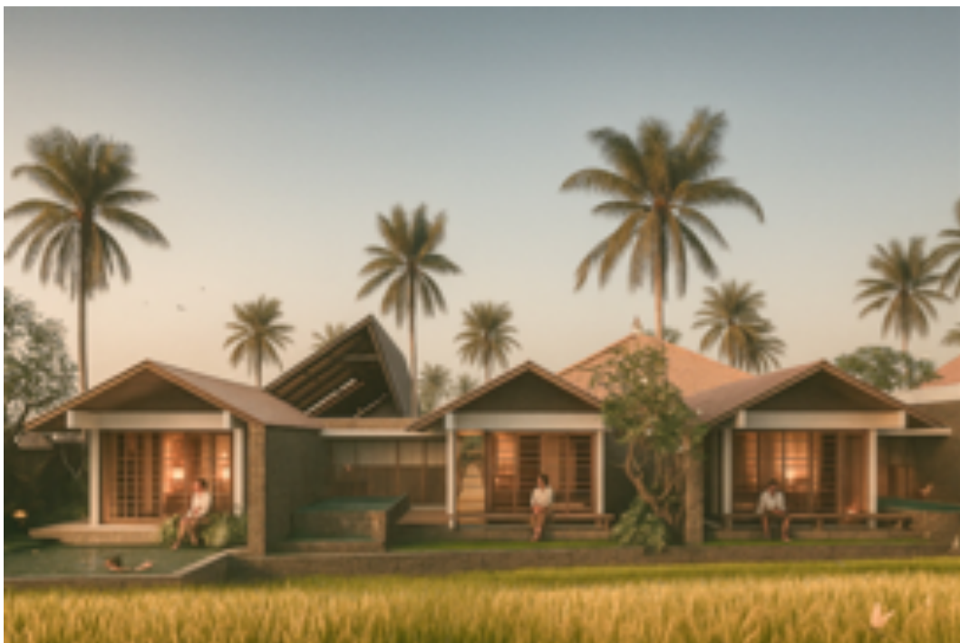
Gambar 6. Gambar marketing fasilitas penginapan

Lebih jauh, hadirnya fasilitas ballroom dan villa yang ditunjukkan oleh Gambar 5, dalam perencanaan, menunjukkan bahwa pelestarian budaya dapat berjalan berdampingan dengan penguatan