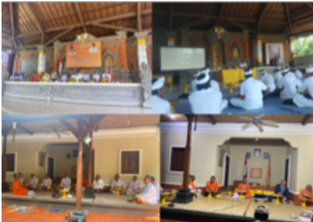
Gambar 1. Suasana Focus Group Discussion dengan para pendeta dan Siwa

Tahap akhir meliputi diskusi spesifikasi material, penyusunan laporan kegiatan, dan penyerahan dokumen. Diskusi material membantu menentukan ekspektasi biaya pembangunan secara realistis. Laporan kegiatan menyajikan seluruh proses, output , dan target yang dicapai dalam format hardcopy dan softcopy , diserahkan kepada institusi perguruan tinggi sebagai bentuk pertanggungjawaban akademik, sekaligus kepada mitra sebagai bentuk transparansi dan penguatan kerja sama. Proses ini diharapkan menjamin kelangsungan pembangunan Pasraman dan event space Griya Gede Kemenuh Keramas secara efisien, profesional, dan sesuai kebutuhan mitra.