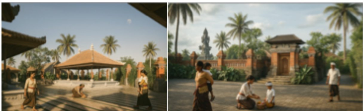
Gambar 4. Gambar Marketing Area Upacara (kiri), dan Area Entrance (kanan)

Meskipun keluaran ini memiliki fungsi strategis dalam proses perencanaan, nilai terpenting yang dicapai adalah perumusan program perencanaan ( programming ) yang menyajikan visi jangka panjang kawasan. Visi tersebut tidak hanya mengakomodasi ruang untuk kegiatan keagamaan dan komunitas, tetapi juga membuka peluang pengembangan ekonomi lokal serta penciptaan lapangan pekerjaan baru bagi masyarakat sekitar.