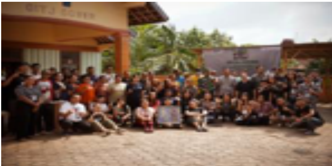
Gambar 6. Seluruh peserta dan warga dukuh Gower pada sesi refleksi dan penutupan

Eko-spiritualitas juga dipahami sebagai tindakan “menyatu dengan alam tanpa merusak.” Melihat alam sebagai bagian kecil dari ciptaan Tuhan untuk selanjutnya menyadari bahwa sebenarnya umat manusia jauh lebih kecil lagi. Arogansi terhadap alam haruslah dikikis agar alam terselamatkan. Sehingga eko-spiritualitas juga bisa dipahami sebagai upaya yang bersifat simbiosis-mutualisme antara alam dan manusia, yaitu dengan “menjaga dan menghargai alam (ciptaan) Allah, (sehingga) alam menenangkan hati kita, (dan) alam akan menyembuhkan (kita).”