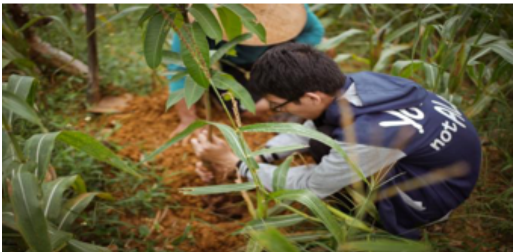
Gambar 5. Aksi Penghijauan di lahan warga dusun Gower di lereng Kendeng.

Hal menanam pohon bisa jadi merupakan kegiatan sederhana yang tidak terlalu bermakna, namun dalam kegiatan P2SM ini ternyata, bagi salah seorang peserta, hal “menanam pohon sambil mendoakan merupakan pengalaman yang berharga bagi saya karena saya menemukan kesamaan antara manusia dan alam.” Kesamaannya adalah bahwa alam dan manusia sama-sama ciptaan Allah yang juga bisa “merasakan sakit dan butuh sesuatu untuk pulih kembali.”