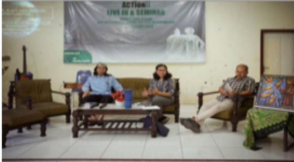
Gambar 2. Seminar Lintas Agama di STAK Wiyata Wacana Pati

Perspektif agama Islam-Kristen tentang alam juga berbeda-beda, namun bisa menemukan satu titik temu, yakni pemahaman bahwa alam yang ada di sekitar berasal dari Tuhan. Seminar ini juga menggugah kesadaran peserta tentang kenyataan bahwa “di dalam alam terdapat Allah” yang dapat dipahami sebagai keyakinan bahwa Allah turut berkarya dalam alam semesta. Ungkapan ini bermaksud mengingatkan bahwa memelihara alam adalah wujud tanggung jawab setiap manusia. Ada pula peserta yang memilih untuk mengidentifikasi dirinya begitu erat dengan alam sehingga dia mengungkapkan “Alam adalah aku dan aku adalah alam yang harus dijaga.”