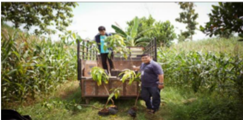
Gambar 4. Lereng pegunungan Kendeng di dukuh Gower tempat aksi penghijauan.

Seorang mahasiswa membagikan pengalaman spiritualnya setelah menanam pohon: "...dengan menanam pohon ini saya merasa saya lebih dekat dengan Tuhan jika dibandingkan dengan Gereja." Mahasiswa tersebut menyebut dirinya seorang naturalis yang memahami meditasi, kontemplasi dan segala bentuk komunikasi dengan alam dapat membantunya menjadi manusia yang 'holistik'. Dia merasa bahwa saat berkomunikasi dengan alam, dia bisa "belajar berhubungan dengan manusia lain sebagai makhluk sosial."