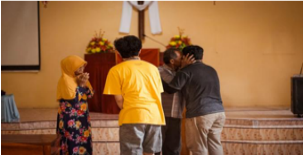
Gambar 3. Proses refleksi peserta dan feedback dari ‘host’ diwarnai keharuan.

Dalam Islam, konsep keramahtamahan dinyatakan melalui ajaran tentang tabiat muslim yang baik dan sikap terbuka terhadap orang lain sebagai wujud dari iman. Sebutan untuk perilaku umat yang baik dan memperlakukan orang lain dalam kebaikan yakni al-ikhsan . Bagi seorang muslim perbuatan baik adalah dimensi lain dari keramahan yang perlu dilakukan oleh semua orang yang beriman. Dalam konteks yang lebih luas, tidak boleh ada perbedaan dalam menawarkan keramahan kepada umat manusia melintasi identitas agama dan budaya dengan satu-satunya tujuan untuk mengamankan perdamaian dan hubungan baik (Mufid, 2019).